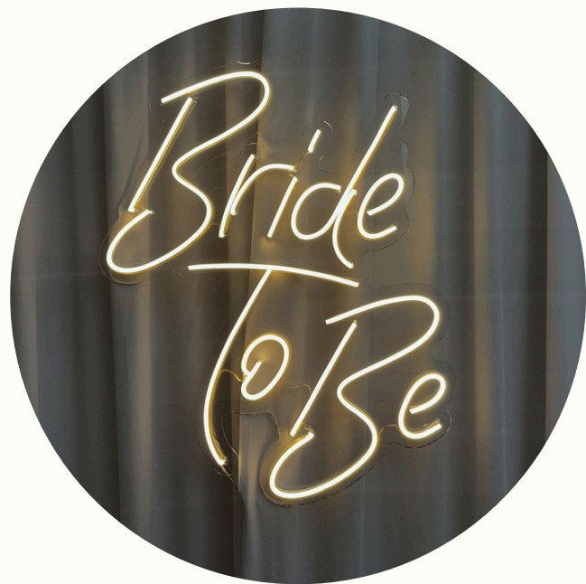
Néon Bride to Be