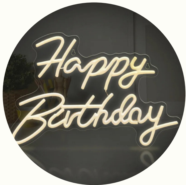
Néon Happy Birthday