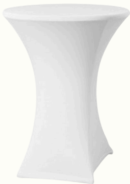
Mange debout avec housse