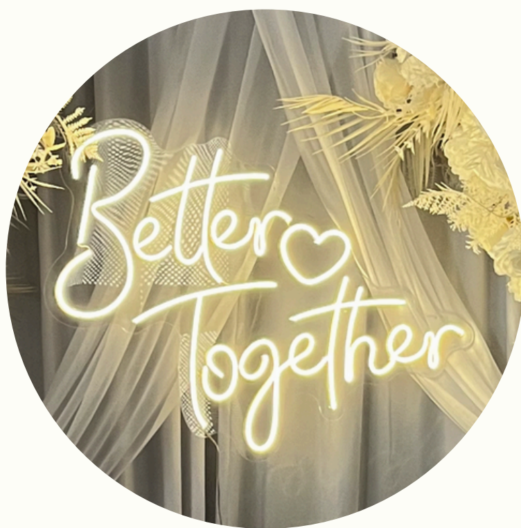
Néon Better Together