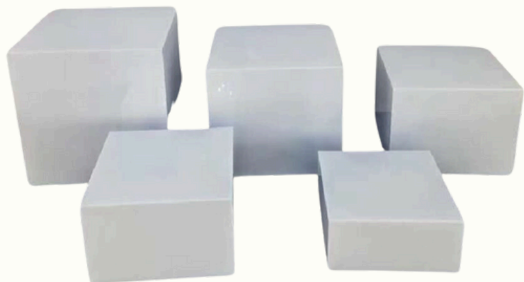
Supports acrylique buffet